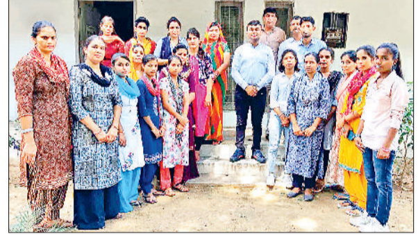
महेन्द्रगढ़। में मेले में उपस्थित छात्राएं व स्टाफ सदस्य।

करवाने, सेना में अग्निवीर भर्ती की जगह नियमित भर्ती करने, धर्मशाला की बिल्डिंग की रिपेयरिंग करवाने बारे चर्चा की गई। प्रधान एडवोकेट अभय राम यादव ने सभी प्रस्ताव पढ़कर सुनाए। सभी सदस्यों ने संतुष्टि जाहिर की। इस मौके पर