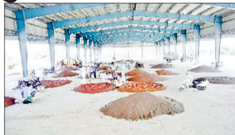
नारनौल। मंडी में टीनशेड के नीचे सरसों फेलाकर सूखाते किसान, खरीद करते एजेंसी के अधिकारी व कर्मचारी व नांगल मंडी में ढेरियों का निरीक्षण करते एसडीएम।