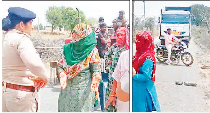
सीमा में 120 से अधिक क्रैशर व माइंस संचालित हैं। जिनमें रोजाना एक हजार से अधिक डंपर लोड होकर दिल्ली-गुरुग्राम के लिए निकलते हैं। सभी डंपरों में क्षमता से अधिक लोड होता है, जिस कारण सड़क मार्ग जर्जर हो चुका है। गड्डों में मिट्टी उड़ने की वजह से लोगों को सांस लेना भी मुश्किल हो गया है। परेशान ग्रामीणों ने क्रैशर संचालकों