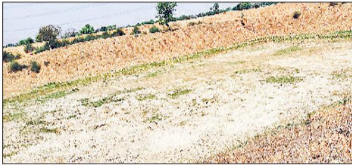
इधर-उधर भटकना पड़ता है। उन्होंने कहा कि गौदला जोहड़ नहर की पाइप लाइन से जुड़ा हुआ है फिर भी उसमें पानी नहीं है। इस प्रकार गांव के सभी जोहड़ सूखे होने से पशु-पक्षियों के जीवन के लिए बेहद चिंताजनक है। ऐसे में मांग करते हैं कि नहर से गांव जैलाफ के जोहड़ों को प्राथमिकता के आधार पर भरवाया जाए।