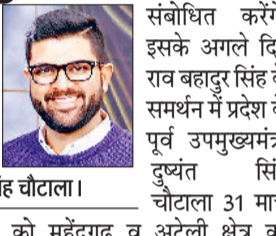
दिविजय सिंह चौटाला।